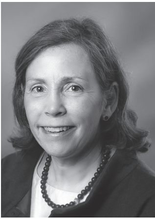
Beatrice Inglin Ombudsfrau